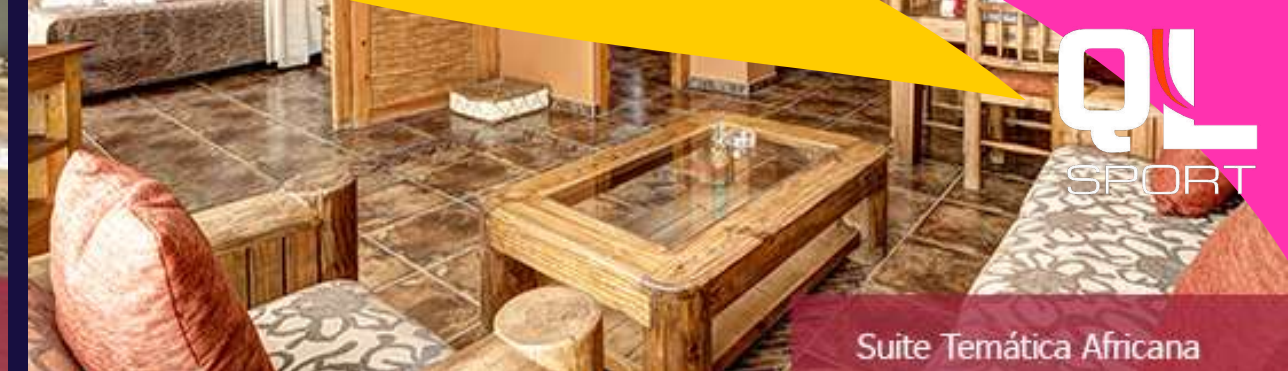
Suite Temática Africana