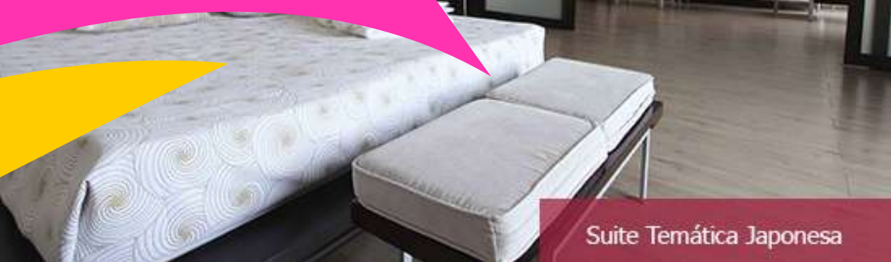
Suite Temática Japonesa