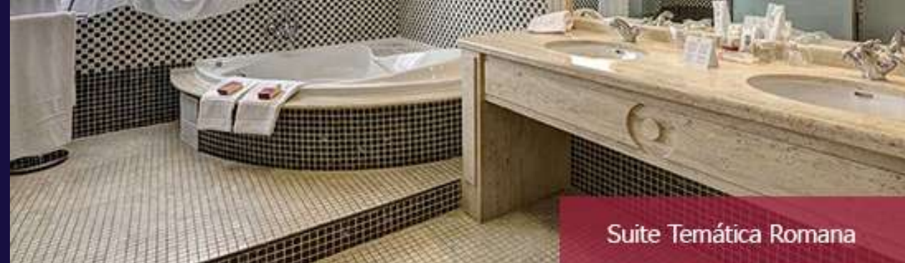
Suite Temática Romana