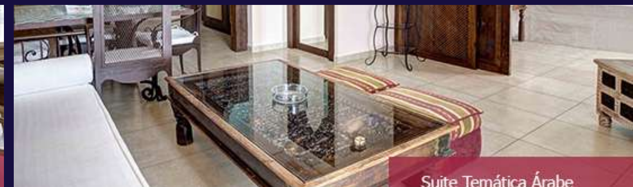
Suite Temática Árabe

QUALITY LIFE SPORT enviará de forma gratuita un talonario por jugador inscrito de pago* de 50 papeletas de 5 € cada una, a aquellos equipos inscritos en el Torneo que lo soliciten.