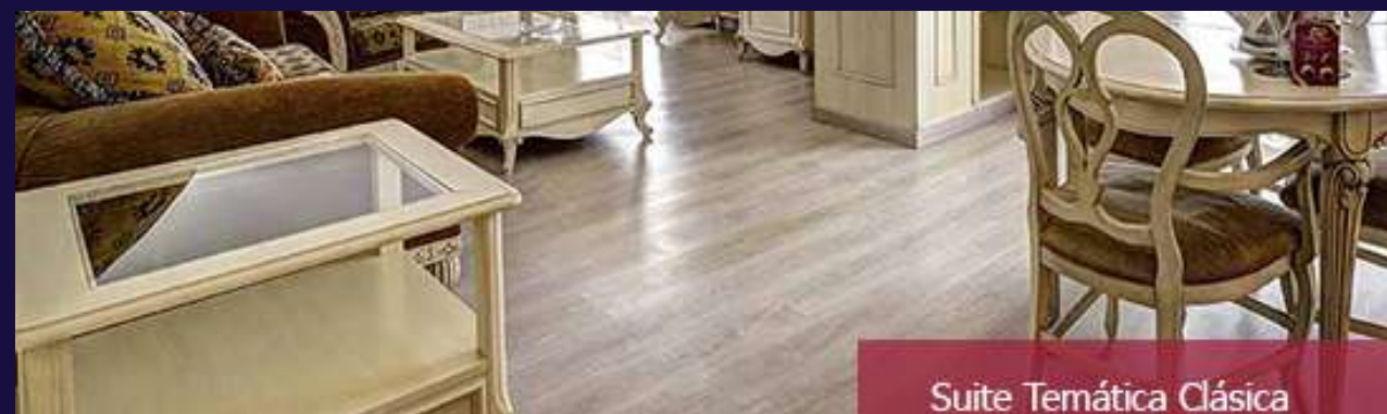
Suite Temática Clásica